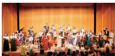
多摩ユースオーケストラ 第44回公演「管弦楽入門2019 Vol.22」 日・場：5月3日(金・祝) 小ホール