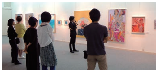
第48回 多摩美術家協会展 日・場：9月21日(土)～9月29日(日) 特別展示室