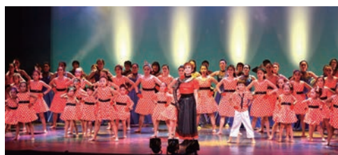
虹の会・バンビーニ・ファンシーレ 第16回ダンス発表会 日・場：10月5日(土) 八王子市南大沢文化会館