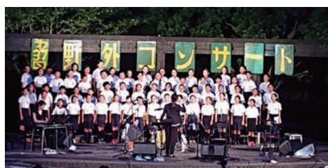
第37回 多摩ニュータウン 野外コンサート 日・場：7月27日(土) 鶴牧東公園