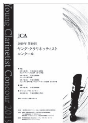
第10回ヤング・クラリネッティスト コンクール 日・場：8月5日(月)～ 8月8日(木) 小ホール