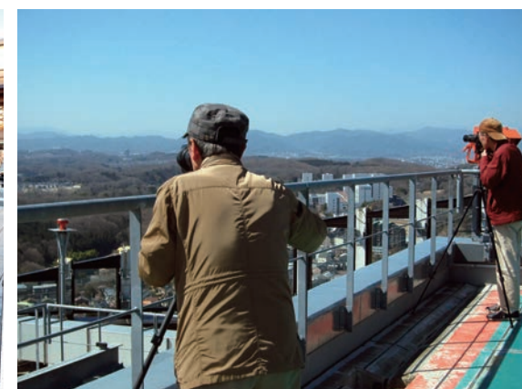
定点撮影プロジェクト