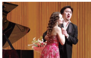
第9回 東日本大震災復興支援 オクサーナ・ステパニユック チャリティーコンサート 日・場：4月21日(日) 小ホール