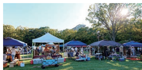
第13回 多摩くらふとフェア2019 日・場：10月13日(日)～14日(月・祝) 多摩中央公園