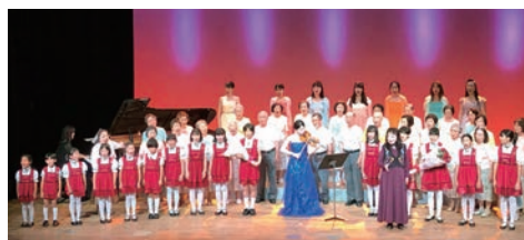
三多摩童謡ファミリーコンサート No.33 新しい時代へつなぐ日本の心・ふるさとのうた ～令和に生きる若者たちと奏でる童謡のびびき～ 日・場：10月20日(日) 小ホール