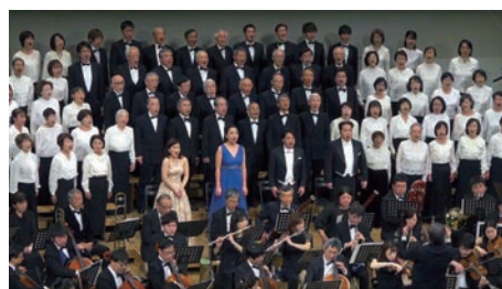
第33回 多摩市民「第九」をうたう会 第5回 ミハラシンフォニカ 第九 演奏会 日・場：2月11日(火・祝) 川崎市総合福祉センター エボックなかはら