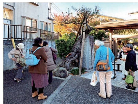
多摩くらしの調査団