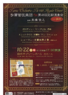
多摩管弦楽団 第48回定期演奏会 日・場：10月22日(火・祝) 調布市グリーンホール