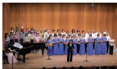
第46回 多摩市合唱祭 日・場：7月14日(日) 小ホール