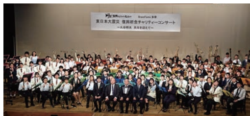
Brass Festa 多摩 2019 パルテノンが音楽の玉手箱になる ～東日本大震災復興祈念チャリティーコンサート～ 日・場：4月5日(金)～4月7日(日) 小ホール 他