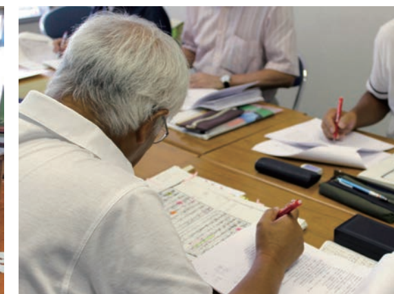
古文書解読ボランティア