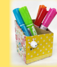
デコパージュベン立て