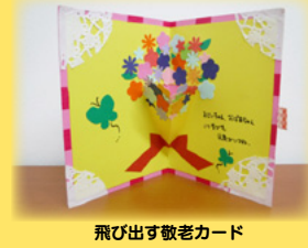
飛び出す敬老カード