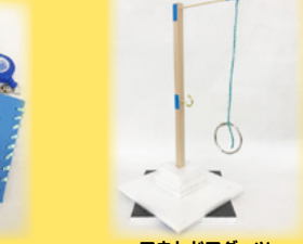
アウトドアダーツ ミニティキトス