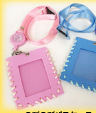
のびのびバスケース