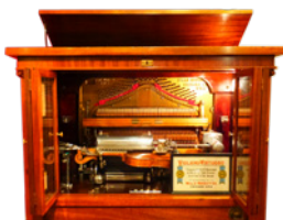
電気のカだけでコンピューターのように動く 1915年・アメリカ製 ミルス・ヴィオラソ・ヴァチュオーソ