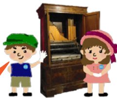
王様が持っていた150年前のバイオリン 1862年・ドイツ製 チェンバー・オルガン