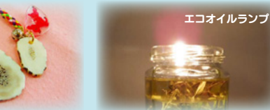
エコオイルランプ