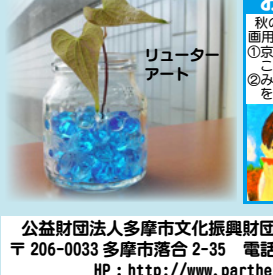
リューターアート