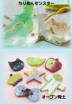
ちりめんモンスター